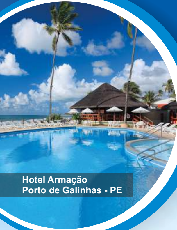
Hotel Armação Porto de Galinhas - PE